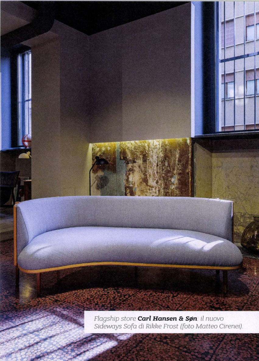
Flagship store Carl Hansen & Søn , il nuovo Sideways Sofa di Rikke Frost.