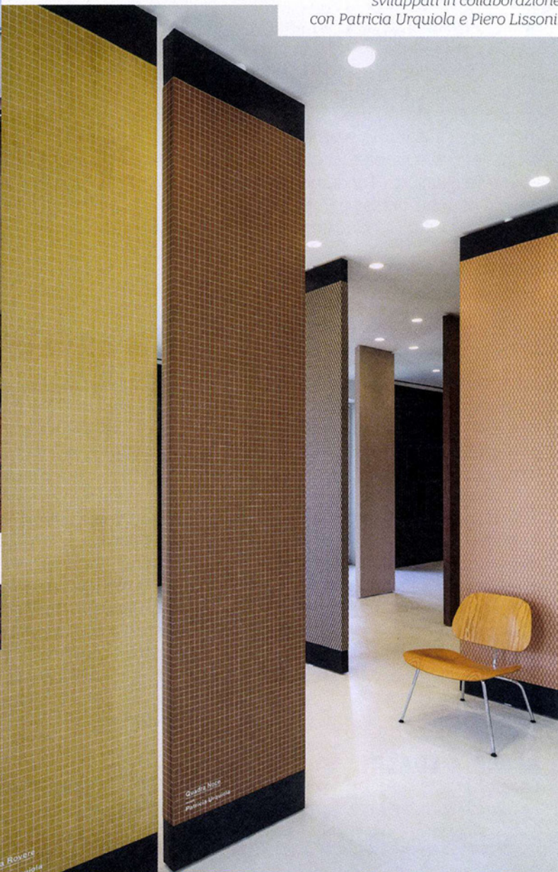
In esposizione nello showroom Alpi , i nuovi pattern lignei, sviluppati in collaborazione con Patricia Urquiola e Piero Lissoni.