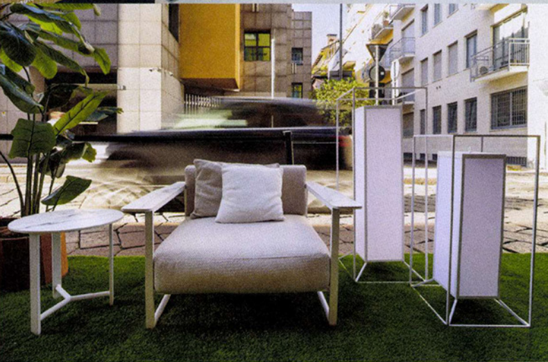
Flagship store Talenti , elementi della collezione Riviera, design Jean-Philippe Nuel: poltrona living con struttura in alluminio e braccioli in gres e tavolo da caffè rotondo con piano in gres.