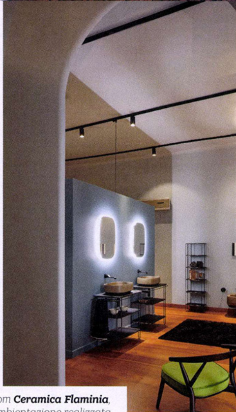
Showroom Ceramica Flaminia , una ambientazione realizzata con basi portalavabo e scaffale in metallo Filo, con lavabo da appoggio e specchio Flag, disegnati da Alessio Pinto.